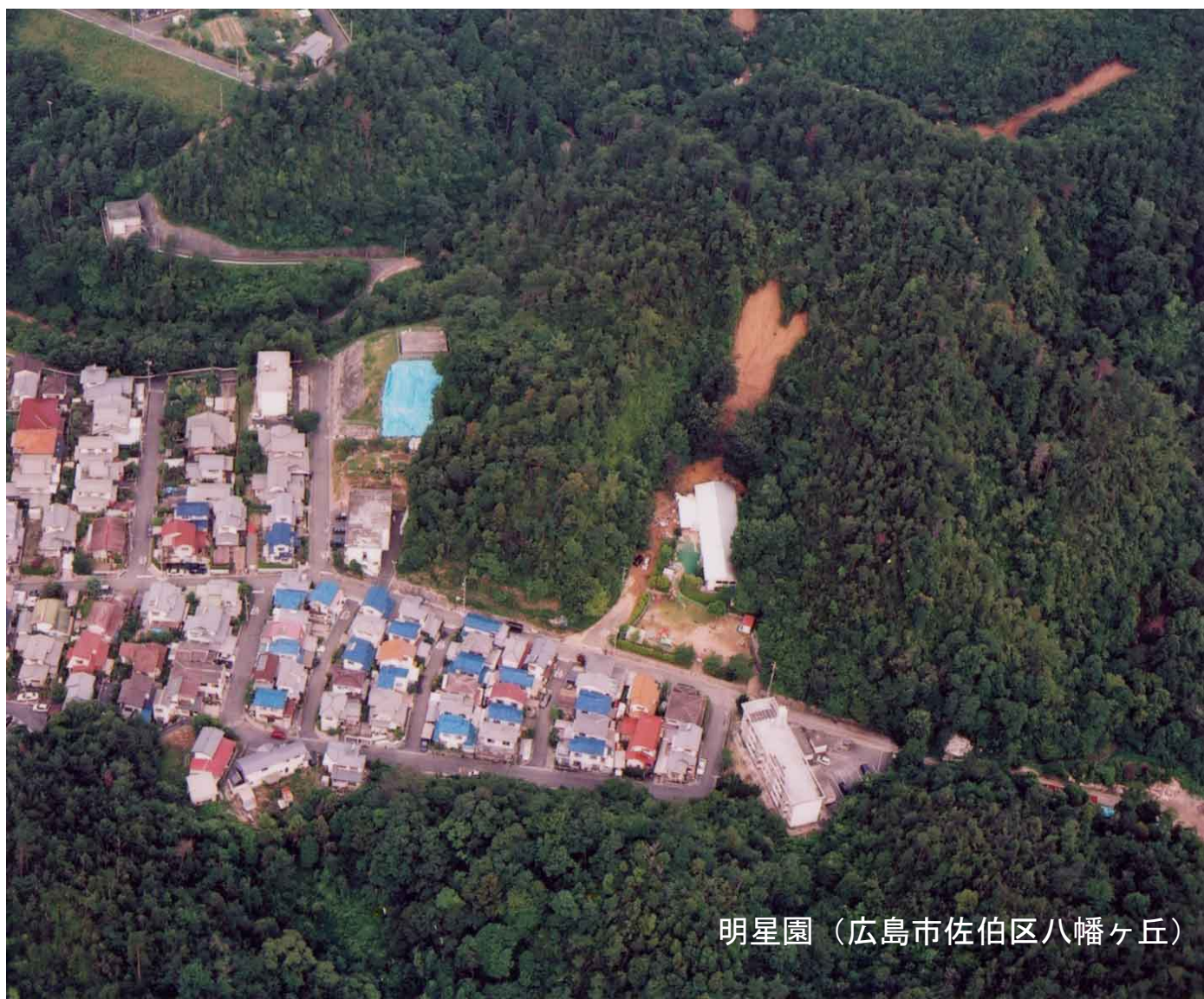
明星園（広島市佐伯区八幡ヶ丘）