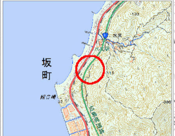
「国土地理院の電子地形図25000『吉浦』を掲載」