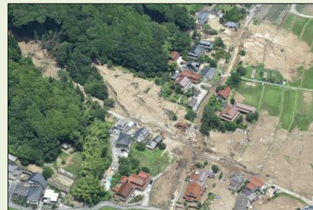
平成30年7月豪雨により竹原市で発生した土砂災害