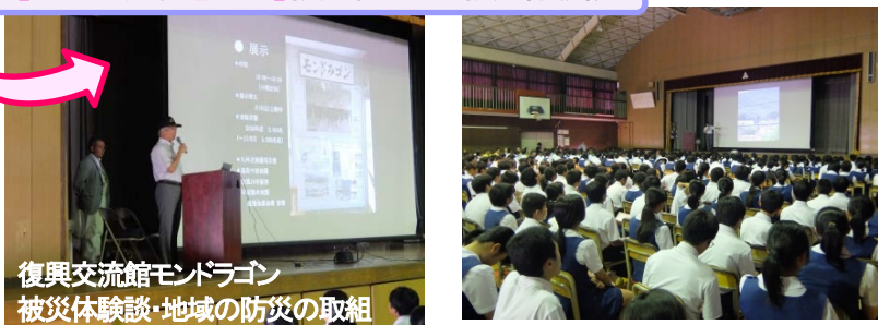
復興交流館モンドラゴン 被災体験談・地域の防災の取組