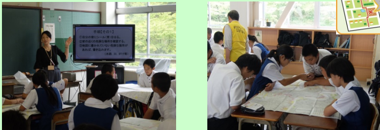
亀山中学生約600名及び先生