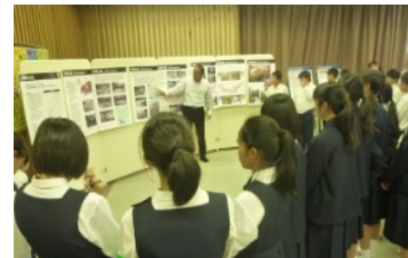
身近な地域の過去の災害を説明