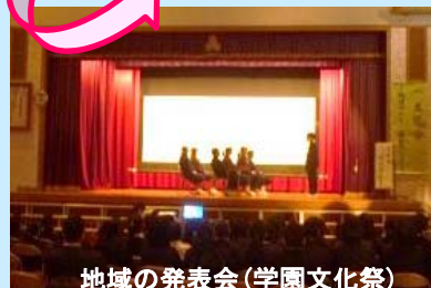
地域の発表会(学園文化祭)

子供たちが、学校の学習発表会等の機会を通じて、家族や地域の方へ、過去に身近で起きた土砂災害について発表するなど、“新たな地域の”語り部”となり、広く地域住民へ伝承した。