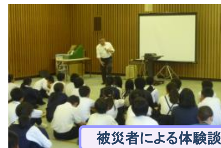
被災者による体験談