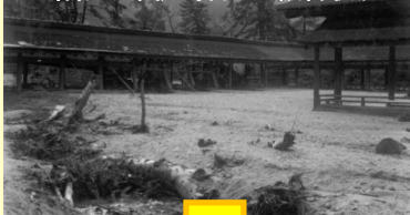
昭和20年枕崎台風 被害状況