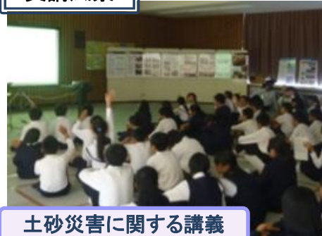
土砂災害に関する講義