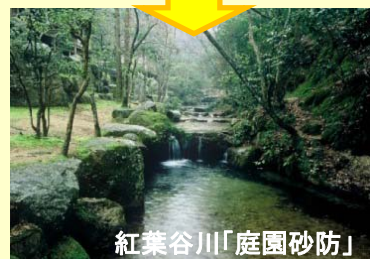
紅葉谷川「庭園砂防」