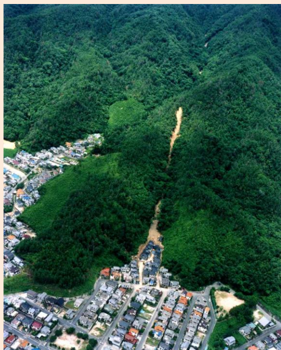
1. 航空写真①「6.29土砂災害(速報版)広島県」