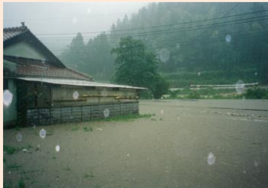
2. 被害の状況③(竹之下地区)