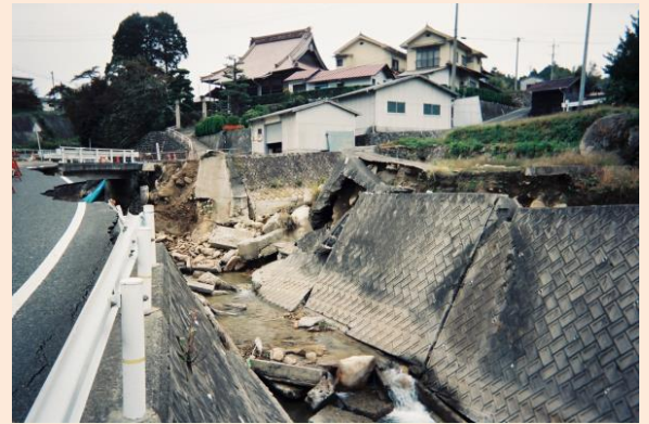
4. 被害の状況①(中畑地区)