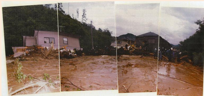
3. 土石流により被災した家屋②