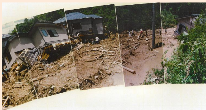
2. 土石流により被災した家屋①