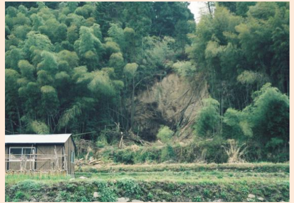
3. 被害の状況⑦(大原地区)