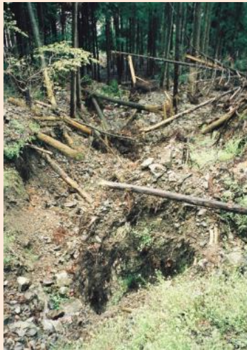
1. 土石流の流下跡⑬(郷坂地区)