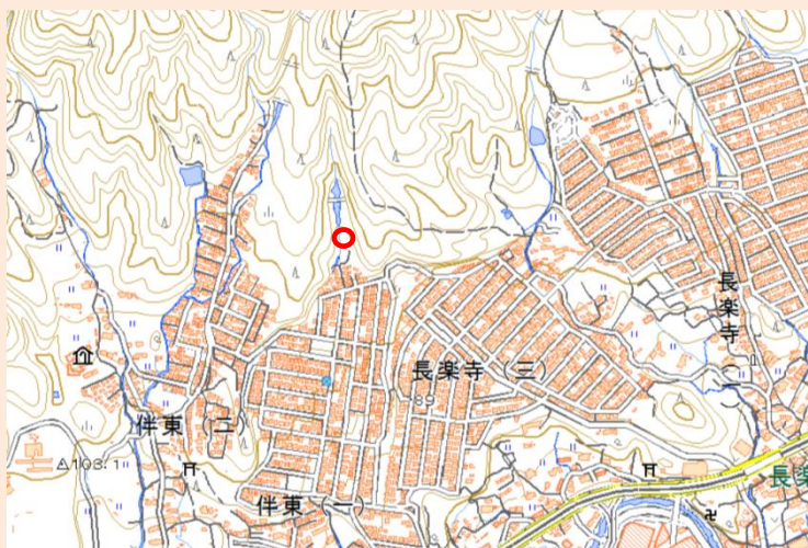
広島市安佐南区伴東1丁目